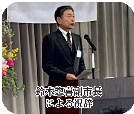
鈴木惣喜副市長 による祝辞