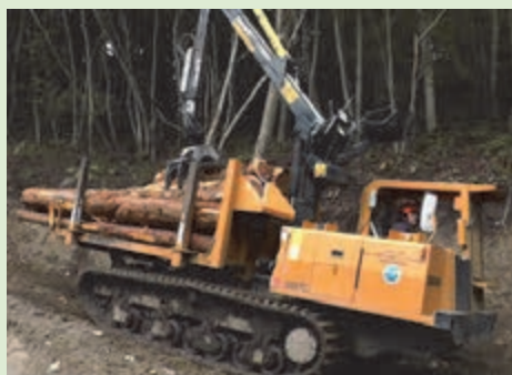
木を積んで自走する