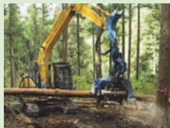
長さを自動計測して 玉切る