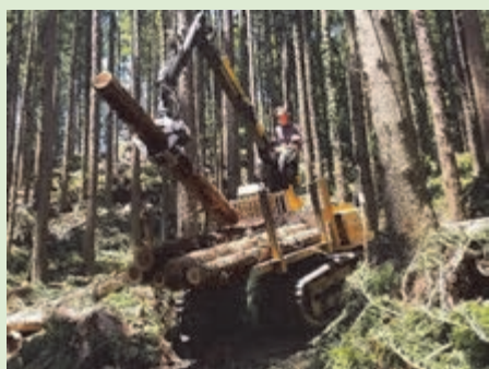
グラップルで木を荷台に積む