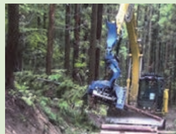
枝を払いながら計測