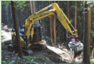
重機が通るための 道路を掘る