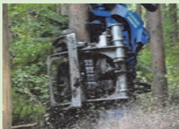
立木をつかんで伐る